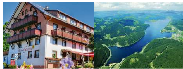
Hotel Sternen, Schluchsee

Bisherige, neue und auch jüngere Feriengäste sind ganz herzlich willkommen. Anmeldeschluss für die Seniorenferienwoche ist der: 15. Mai 2026. Auf Ihre Anmeldung freuen sich und erteilen gerne Auskunft: Sonya Marti Schai, Fuhrenweid 256, 3096 Oberbalm 031 829 30 35 / 079 322 27 89 Marianne Steffen, Bernstrasse 22, 3086 Zimmerwald 079 215 04 38