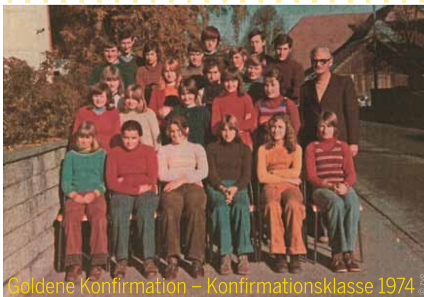
Goldene Konfirmation – Konfirmationsklasse 1974

Wir laden herzlich zum Weltgebetstag am 1. März, 20 Uhr, Kirche Zimmerwald ein.